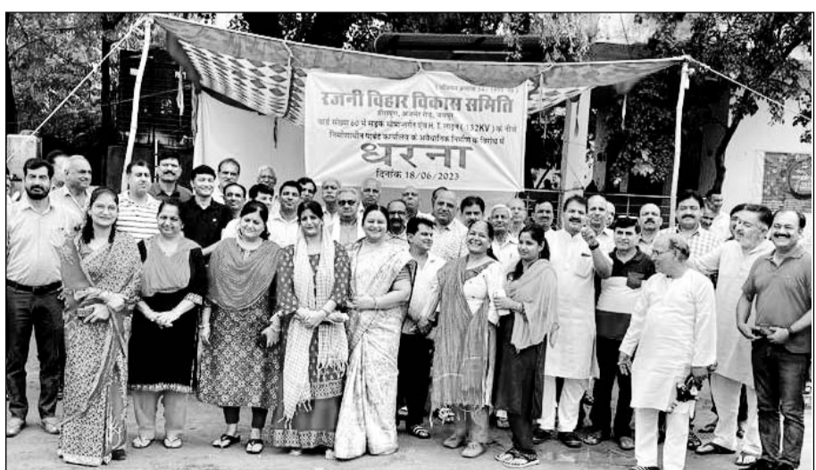
पृथ्वीराज नगर क्षेत्र के दशहरा मैदान में हाईटेशन विद्युत लाइन के नीचे पार्श्व कार्यालय बनाने के विरोध में रविवार को सैकड़ों लोगों ने प्रदर्शन किया।

रजनी विहार और आसपास की कॉलोनियों के सैकड़ों लोगों ने निर्माणस्थल पर धरना देकर नारेबाजी की