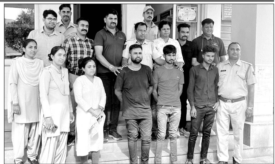
क्रिश्चयन गंज थाना पुलिस ने आरोपियों को गिरफ्तार किया।