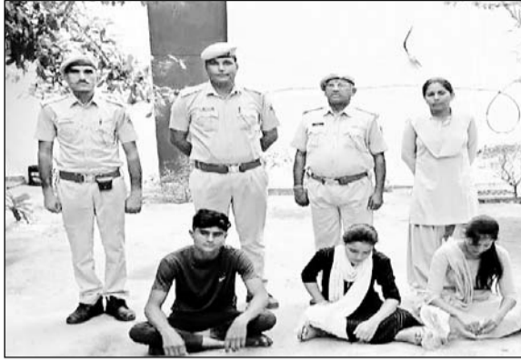
जालोर जिले की आहोर पुलिस ने कूट रचित दस्तावेज तैयार कर फर्जी रूप से परीक्षा देने वाले तीन लोगों को गिरफ्तार किया।