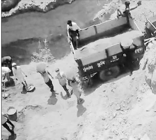
अलवर थाना उद्योग नगर क्षेत्र में अवैध बजरी खनन करते लोग।

अवैध बजरी खनन से परेशान किसानों ने पुलिस कंट्रोल रूम जयपुर व पुलिस कंट्रोल रूम अलवर को माफिया की शिकायत की। किसानों ने बताया कि एम आई ए थाना उद्योग नगर क्षेत्र के गांव केसरोली किला से 1 किलोमीटर दूरी पर जोगी नगला के आस-पास व बगड़ राजपूत क्षेत्र में अवैध बजरी खनन जोरों पर है। किसानों ने बताया कि उपजाऊ जमीन के आस-पास लगभग 20-30 फीट गहरे गड्ढे कर दिए हैं। माफिया ने विरोध कर रहे किसानों को धमकाया