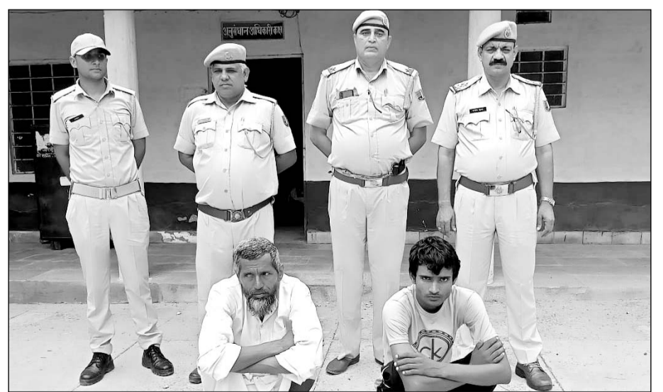
मुखबिर की सूचना पर जुरहरा थाना पुलिस ने आरोपियों को गिरफ्तार किया।