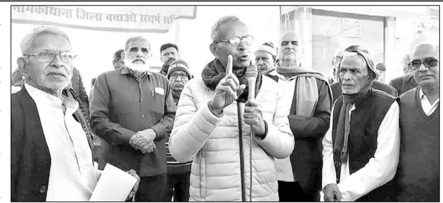
धरने को कई वक्ताओं ने संबोधित किया।

जानकारी के अनुसार जिले को बचाने के लिए मंगलवार को अग्रवाल समाज समिति, विप्र समाज, राजस्थान पेंशनर्स मंच और ग्राम पंचायत नाथा