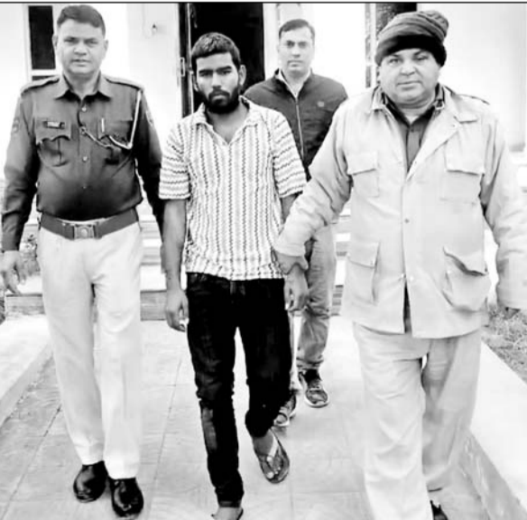
पाटन पुलिस ने चोरी के आरोपी को गिरफ्तार किया।

मामले की गंभीरता को देखते हुए पाटन पुलिस ने अज्ञात आरोपियों को तलाश में मुखबिर तंत्र और सूचनाओं