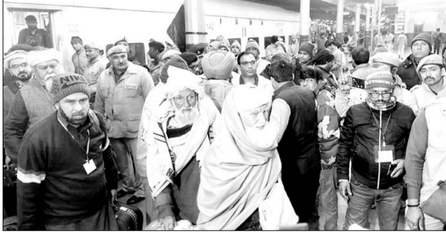
मंगलवार अल सुबह अजमेर रेलवे स्टेशन पहुंचे पाक जायरीन।

मंगलवार अलसुबह पाक जायरीन के अजमेर पहुंचने से पहले जिला पुलिस, खुफिया तंत्र, जीआरपी और आरपीएफ के जवानों ने प्लेटफार्म नंबर सुरक्षा घेरे में लिया। ट्रेन जैसे ही रेलवे स्टेशन पर रुकी तो पाकिस्तान से आए जायरीन की आंखों में खुशी के आंशु छलक उठे। ट्रेन के कोच से उतरते ही जायरीन ने अजमेर की सरजमीं को चूमते हुए ख्वाजा साहब का शुक्रिया अदा किया। रेलवे स्टेशन के बाहर मीडिया के सबालों का जवाब देते हुए भारत सरकार की ओर से किए गए इंटरजाओं की सराहना की, उन्होंने कहा कि दोनों देशों के बीच