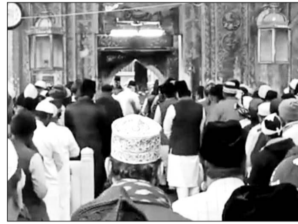
ख्वाजा मोइनुद्दीन हसन चिश्ती की महाना छठी पर दरगाह में उमड़ी जायरीन की भीड़।

हाजरी देकर अमन-चैन और भाईचारे की भी दुआएं मांगी। सरवाड़ में चल रहे ख्वाजा फखरुद्दीन के सालाना उर्स में जायरीन ने शिरकत की।