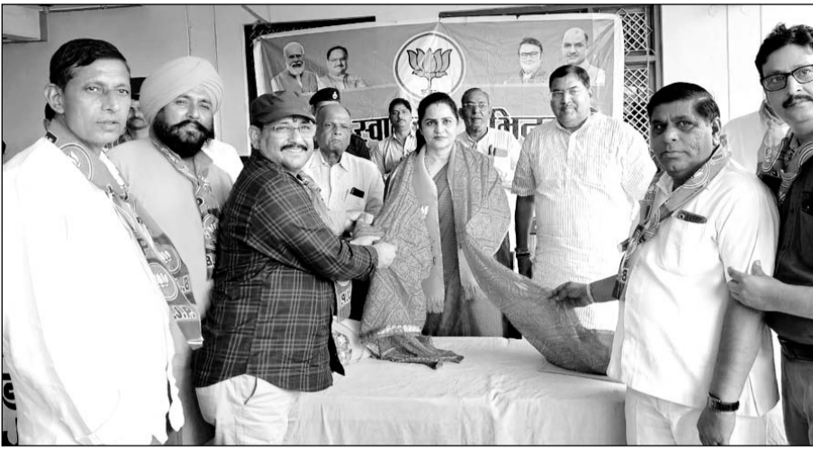
भाजपा चुनाव प्रभारी व सांसद सुनीता दुग्गल का खैरथल पहुंचने पर पदाधिकारियों ने स्वागत किया।

को समय है मां की सेवा का है। एक-एक कार्यकर्ता की सेवा किशनगढ़ बास व राजस्थान को विकसित प्रगतिशील बनाने में योगदान देना। राजस्थान प्रदेश में बढ़ते भ्रष्टाचार अपराध को रोकने का काम करेगी। और यह संभव तभी होगा जब हम एक जुट होकर सेवा के भाव से काम करेंगे। दुग्गल ने कहा किशनगढ़ बास सहित अलवर उतर की पांचों सीटों के साथ राजस्थान में कमल खिल रहा है और पूर्ण बहुमत के साथ भाजपा की