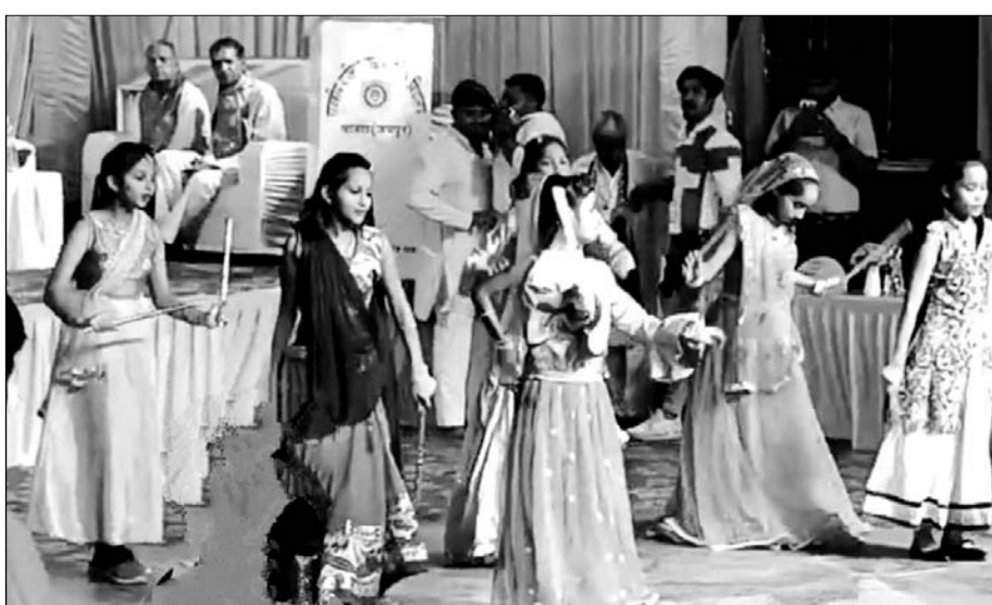
नन्ने-मुन्ने बच्चों ने सांस्कृतिक कार्यक्रम प्रस्तुत किये।