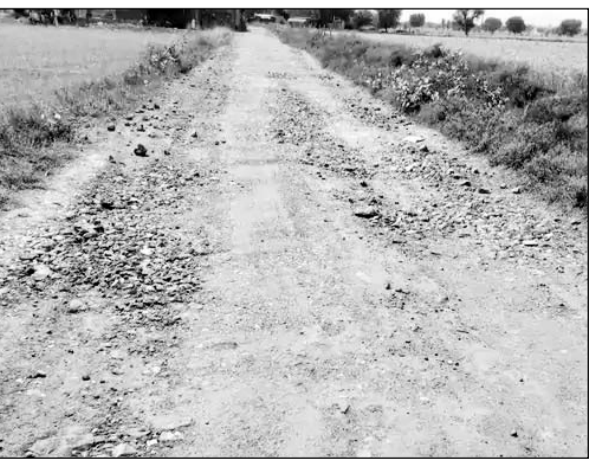
अलवर ग्रामीण विधानसभा क्षेत्र में दादर जयंती फैक्टरी के पास से पलखड़ी जाने वाली सड़क कई जगह से उखड़ गई है।

■ सड़क की बदहाली को लेकर ग्रामीणों में भारी आक्रोश है ■ ग्रामीण कई बार संबंधित अधिकारियों को लिखित शिकायतें कर चुके हैं