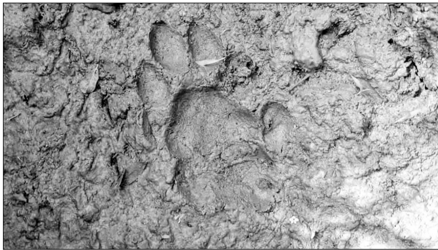
डाटुन्दा क्षेत्र में पैथर के पगमार्क देखे गये।

बूंदी, (निसं)। रामगढ़-विषधारी टाइगर रिजर्व के बफर जोन की हिंडोली रेंज के डाटुन्दा क्षेत्र में शुक्रवार रात एक पैथर ने बाड़े में बंधे बछड़े को शिकार बना डाला। पैथर बछड़े को आधा खा गया। शनिवार सुबह किसान ने इसकी सूचना वन