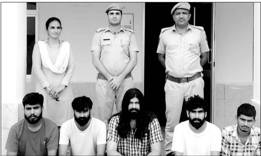
दुधवाखारा पुलिस की टीम ने मारवाड़ 0018 गैंग के पांच सदस्यों को गिरफ्तार किया।