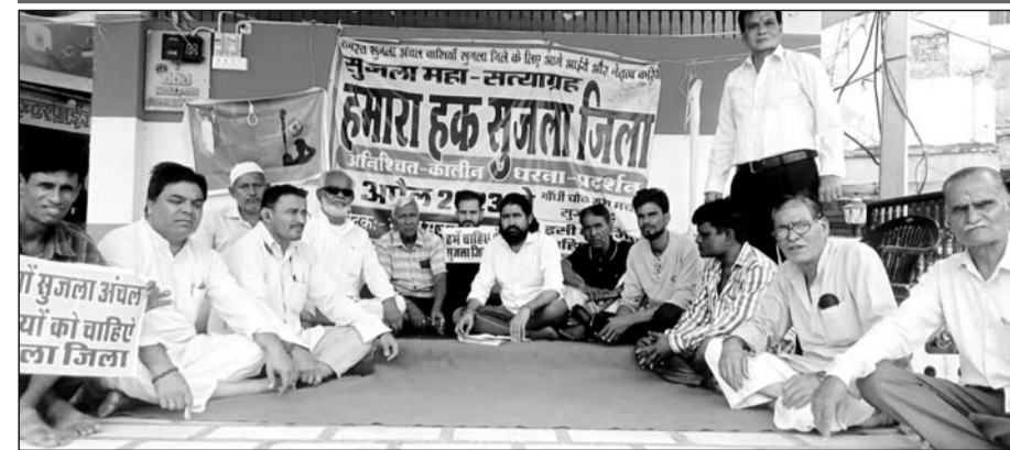
सुजानगढ़ के गांधी चौक में सुजला जिले की मांग को लेकर धरना जारी है।

आचार संहिता लगने से पूर्व आंदोलन किया जाएगा तेज