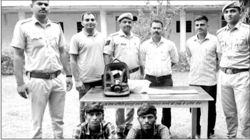
पुलिस ने मोबाइल शोरूम से हुई चोरी का खुलासा करते हुए दो आरोपियों को गिरफ्तार किया।