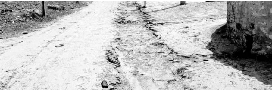
गांव चारिया में सड़क के बीच में जेसीबी से खोदी गयी सड़कें।

सुजानगढ़, (निस)। ग्राम पंचायत मुरडाकिया के चारिया गांव में जेजेएम योजना के तहत घर-घर कनेक्शन के लिए तोड़ी गयी से ग्रामीण परेशान है। ग्रामीणों ने बताया कि जेजेएम योजना में प्रत्येक घर को नल से जोड़ने के लिए गांव की गलियों की खुदाई की गयी थी। "आपणी योजना" के ठेकेदार द्वारा सड़क तोड़ दी गयी लेकिन उनकी मरम्मत नहीं करवायी गयी।