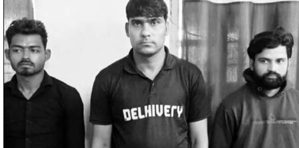
फायरिंग कर फरार होने पर पुलिस ने तीन जनों को गिरफ्तार किया।

भरतपुर, (कासं)। भरतपुर के मथुरा मार्ग पर धौरमुई ऑथल डिपो के सामने रविवार रात को फायरिंग कर फरार हुए तीन युवकों को पुलिस की तीन अलग अलग टीमों ने गिरफ्तार कर उनके कब्जे से 3 देशी कट्टा 315 बोर, 5 जिंदा राउण्ड 315 बोर, 7 खाली केस 315 बोर, एक आल्टो नम्बर डीएल 9 सीएन 2594, एक आर्टिका कार नम्बर आरजे 14 टीई 4628, एक मोटर साइकिल हीरो एचएफ डीलक्स आरजे 05 जीएस 4306, नीवो कम्पनी का 1 मोबाइल फोन बरामद किया गया।