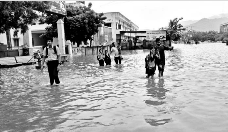
अजमेर में रेस्क्यू टीम ने छोटे बच्चों को कंधों पर बड़े बच्चों को रस्से के सहारे पानी में से बाहर निकाला।

अजमेर, (कासं)। अजमेर शहर में लगातार हो रही बारिश से स्मार्ट सिटी की पोल खोल कर रख दी है। शहर में शुक्रवार को स्थिति उस समय भयावह हो गई, जब मूसलाधार बरसात से बाढ़ जैसे हालात उत्पन्न हो गए। खासकर उन