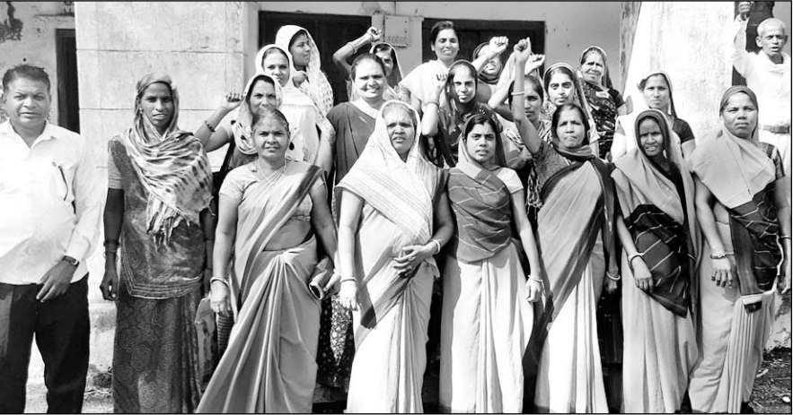
केंद्रीय मद से बकाया मानदेय भुगतान कराने की मांग को लेकर विरोध प्रदर्शन करती आंगनवाड़ी कार्यकर्ता।

पिछले समय मे देश के मजदूर आंदोलन ने केंद्र सरकार की मजदूर विरोधी नीतियों खिलाफ हड़ताल कर चेताया था कि गरीबी की हालात में जी रही महिला कार्मिकों की मांगों पर ध्यान दिया जाए। इसके बावजूद भी इन महिला कार्मिकों के लिए पेंशन वेतन व सरकारी कर्मचारी का दर्जा नहीं देकर घोर