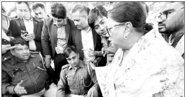
जानकारी मिलते ही वसुंधरा राजे घायल पुलिसकर्मीयों के पास पहुंची।

पाली, (नि.सं.)। पाली जिले में पूर्व मुख्यमंत्री वसुंधरा राजे के काफिले की एस्कॉर्ट कर रही पुलिस की जीप पलटी गई। हादसे में कुछ पुलिसकर्मी घायल हो गए, जिन्हें बाली के राजकीय अस्पताल में भर्ती कराया गया है।