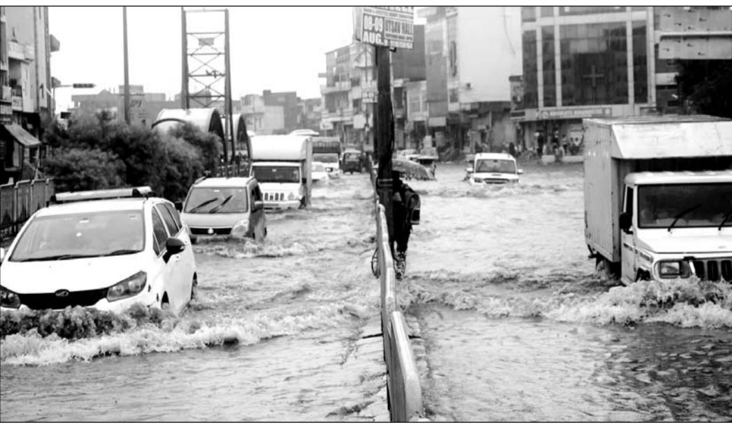
सोमवार को लगातार तीसरे दिन तेज बारिश के कारण सीकर रोड स्थित ढेहर के बालाजी क्षेत्र में मुख्य सड़क पर 3 फीट तक पानी भरा रहा। इस दौरान यहां से गुजरने वाले वाहन चालकों को भारी परेशानियां झेलनी पड़ी।

यहां के पानी की निकासी अमानीशाह नाले से कनेक्ट कर दी जाए तो इस समस्या का समाधान हो जाएगा। कालवाड़ रोड पर रावण गेट चौराहे से