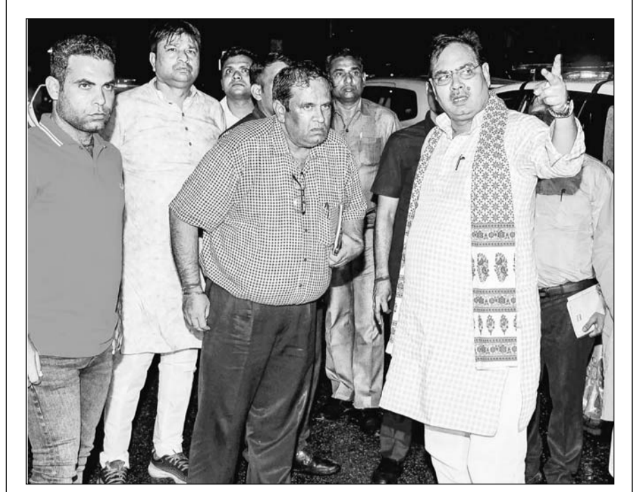
मुख्यमंत्री भजनलाल शर्मा ने सोमवार शाम को जयपुर शहर में हुई तेज बारिश के दौरान जवाहर सर्किल, मालवीय नगर अंडर पास, सांगानेर क्षेत्र, चाम्पू पुलिसिया, ढेर के बालाजी चौराहा, 9 नंबर और 14 नंबर चौराहे का जायजा लिया।