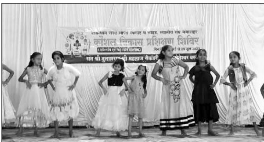
स्काउट-गाइड के कौशल विकास प्रशिक्षण शिविर के समापन पर रंगारंग नृत्य की प्रस्तुतियां देते प्रतिभागी।