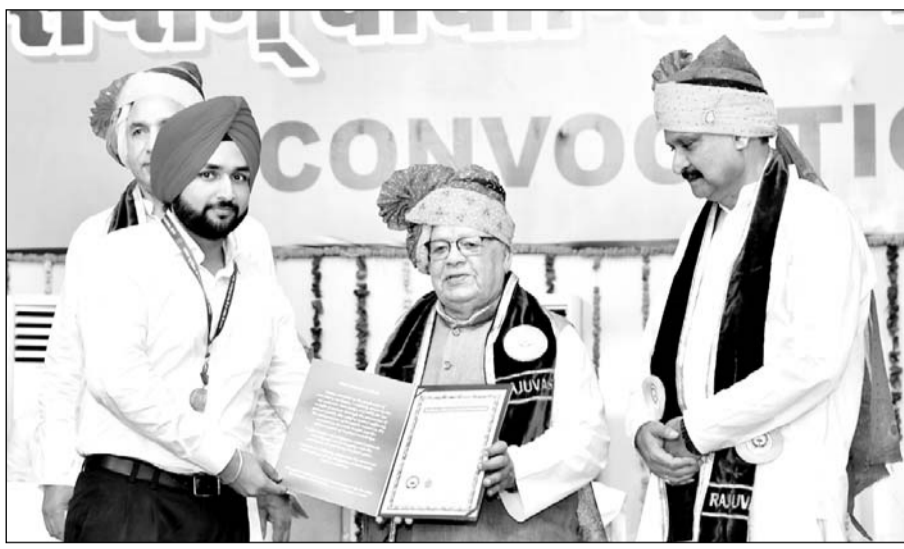
बीकानेर के वेटनरी विश्वविद्यालय के दीक्षांत समारोह में राज्यपाल कलराज मिश्र ने स्वर्ण पदक व उपाधियां प्रदान कीं।

राज्यपाल ने कहा कि बढ़ती जनसंख्या घटती कृषि जोत पानी तथा अन्य प्राकृतिक संसाधनों की कमी मनुष्य के लिए एक बड़ी चुनौती है। ऐसे में पशुधन और पशु उत्पाद ही पोषण सुरक्षा की दृष्टि से वरदान साबित हो सकते हैं। इसके लिए खाद्य और दूध उद्योग में छोटे और मध्यम उद्यमों को बढ़ावा देने की आवश्यकता है। राज्यपाल मिश्र ने कहा कि राजुवास तीन संघटक पशु चिकित्सा विज्ञान महाविद्यालयों एक डेयरी एवं खाद्य प्रौद्योगिकी महाविद्यालय आठ सम्बद्ध महाविद्यालयों तथा 101 डिप्लोमा संस्थानों के माध्यम से प्रदेश में पशु चिकित्सा शिक्षा अनुसंधान एवं प्रसार के क्षेत्र में सराहनीय कार्य कर रहा है। ऐसे में विश्वविद्यालय प्रसार शिक्षण के