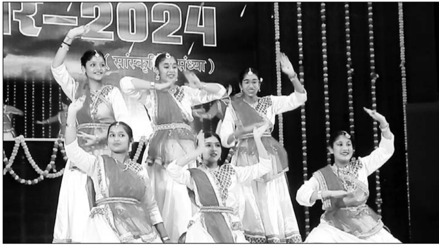
महाराणा प्रताप सभागार (टाउन हॉल) में संस्कृति संध्या मल्हार-2024 में कलाकारों ने कार्यक्रम पेश किया।