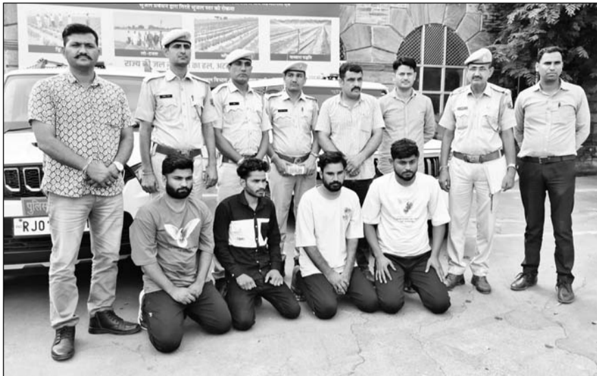
गांधीनगर थाना क्षेत्र में हुई फायरिंग मामले में चार आरोपियों को गिरफ्तार किया।

पुलिस ने वारदात में प्रयुक्त हथियार भी बरामद किया