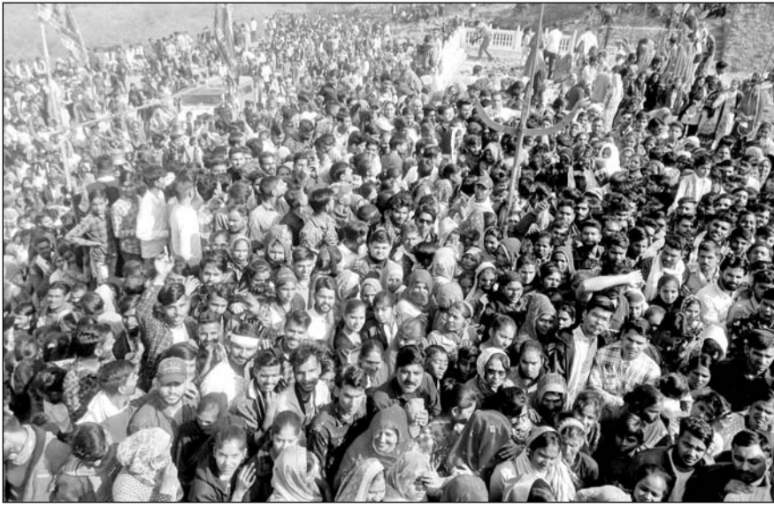
बाणगंगा में पहाड़ी पर स्थित चौथ माता के दर्शनों के लिये श्रद्धालुओं की भीड़ उमड़ी।

अवसर पर देर रात तक श्रद्धालुओं की भीड़ मंदिर की ओर जाती नजर आई। इस अवसर पर चौथ माता मंदिर परिसर में लगे मेले में ग्रामीणों ने जमकर खरीददारी की। वहीं बड़ी मात्रा में प्रसाद व फूलमालाओं की बिक्री हुई। नैनवां रोड़, माटूंदा रोड़ चौराहा, मौरागेट, रामद्वारा लंकागेट, खोजागेट, चितौड़ रोड़, सिलार रोड़ सभी जगह श्रद्धालुओं के लिए भंडारें आयोजित किए गए।