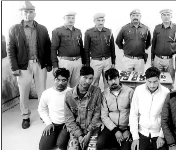
पुलिस ने मोबाइल चोरी के आरोपियों को पकड़ा।

अजमेर, (कास)। विश्व विख्यात सुफी संत हजरत ख्वाजा गरीब नवाज के सालाना उर्स में जायरीनों के मोबाइल चोरी करने वाली गैंग के पांच आरोपियों को दरगाह थाना पुलिस ने गिरफ्तार किया है। आरोपियों के कब्जे से 6.30 लाख कीमत के 21 मोबाइल बरामद किए हैं। आरोपी भीड़ का फायदा उठाकर वाराणसी के अंजाम देते हैं।