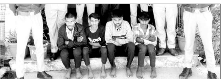
कार पर पथराव कर शीशे तोड़ने के आरोपियों को पुलिस ने गिरफ्तार किया।

डूंगरपुर, (निर्स)। कोतवाली थाना पुलिस ने चार बदमाशों को गिरफ्तार किया है। बदमाशों ने कार और ऑटो के बीच टक्कर के बाद पथराव कर दिया था, जिसमें कार के शीशे फूट गए थे। मामले में पुलिस आरोपियों से पूछताछ कर रही है।