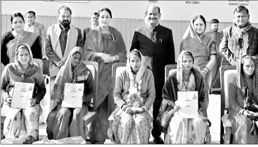
कोटा में "सुपोषित मां" अभियान के तहत लोकसभा अध्यक्ष ओम बिरला और उपमुख्यमंत्री दिया कुमारी ने गर्भवती महिलाओं को पोषण किट दिये।

कोटा, (निर्स)। कोटा-बूंदी संसदीय क्षेत्र में गरीब एवं वंचित वर्ग की गर्भवती महिलाओं के उचित पोषण एवं स्वास्थ्य सुरक्षा के उद्देश्य से संचालित "सुपोषित मां" अभियान के तीसरे चरण का शुभारम्भ शुक्रवार को यहां छपन भोग परिसर से लोकसभा अध्यक्ष ओम बिरला एवं उपमुख्यमंत्री दिया कुमारी ने किया। कार्यक्रम में गरीब एवं अभावग्रस्त परिवारों की 1500 गर्भवती महिलाओं को पोषण किट वितरित किए गए।