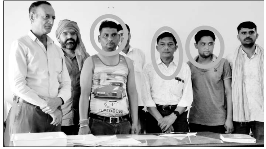
भरतपुर एसीबी की टीम ने डींग कस्बे में कार्रवाई कर आरोपियों को गिरफ्तार किया।