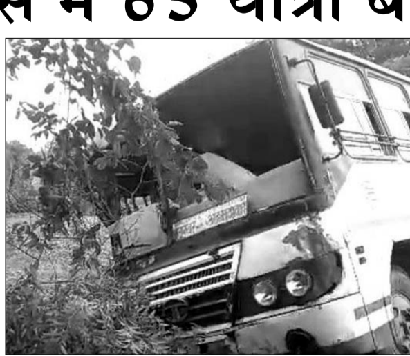
तीजवड मोड़ के पास सड़क किनारे से नीचे उतरी रोडवेज बस।

घटना के बाद इंगूरपुर से रोडवेजकर्मियों, पुलिस मौके पर पहुंचे और घायलों को बस से बाहर