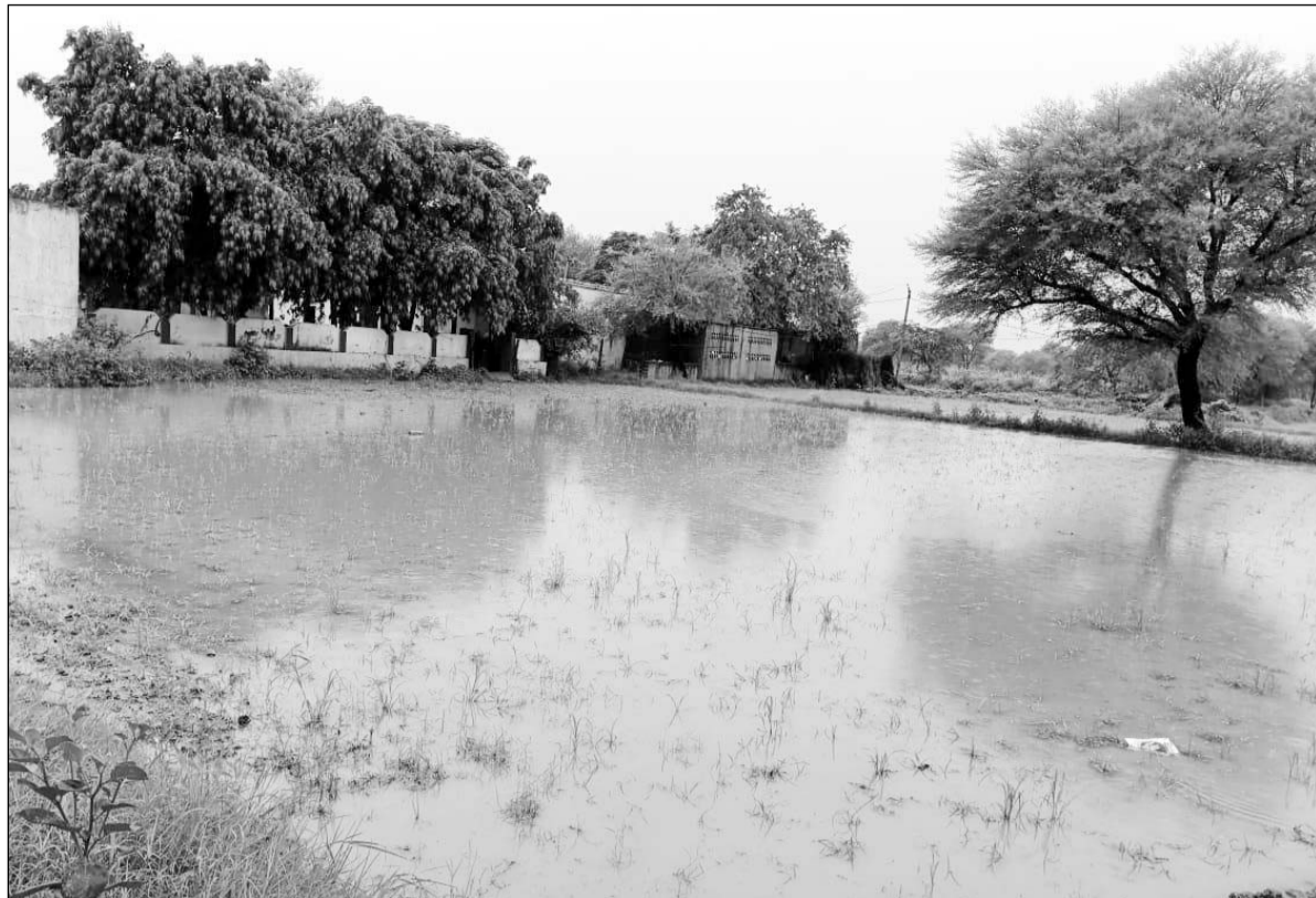
पावटा में मूसलाधार बरसात होने से खेतों में पानी भर गया।

बारिश ने शहर से लेकर देहात तक तबाही मचा दी, गरीबों के कच्चे मकान भी ढह गए