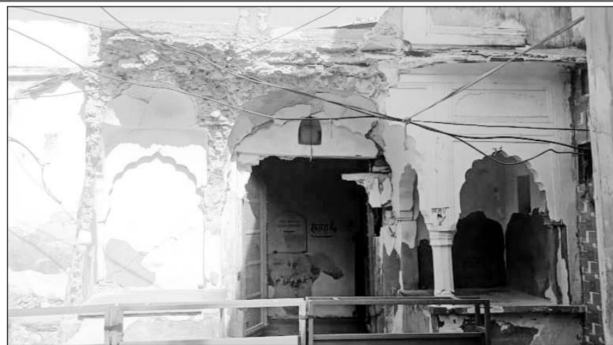
सांभर का प्राचीन चारभुजा नाथ मंदिर जीर्णोद्धार के अभाव में लगातार जर्जर होता जा रहा है।