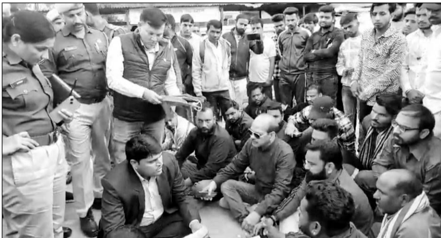
कोटा में मासूम की मौत के बाद आक्रोशित लोग पोस्टमार्टम रूप में बाहर ही धरने पर बैठ गये, जिनसे मिलने यूआईटी के अधिकारी मौके पर पहुंचे।

कोटा, (निर्स)। सुभाष नगर इलाके के खाली प्लॉट में दुबने से मासूम की मौत के मामले में मोर्चों के बाहर परिजनों और भाजपा पार्षदों ने हंगामा खड़ा कर दिया। मुआवजा दिलवाले व यूआईटी के अधिकारियों के खिलाफ कार्रवाई की मांग को लेकर परिजन और स्थानीय लोगों ने पोस्टमार्टम रूप के बाहर धरना दिया। परिजनों ने नारेबाजी कर प्रदर्शन किया और आक्रोश जताया।