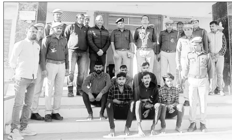
पुलिस ने डकैती की योजना बनाते छह जनों को गिरफ्तार किया।

तीन अवैध देशी पिस्टल, छुरा व मिर्ची पाउडर बरामद