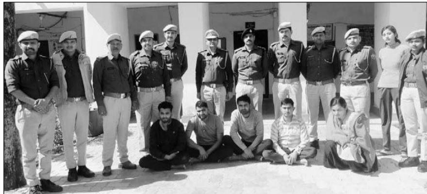
भीण्डर पुलिस ने हत्या के आरोपियों को गिरफ्तार किया।