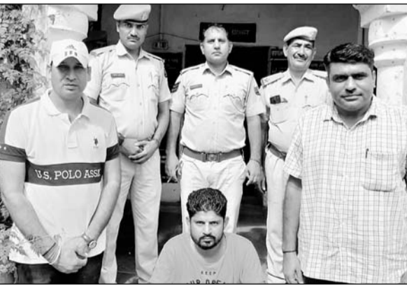
खेतड़ी पुलिस ने हथियार तस्कर को गिरफ्तार किया।

■ आरोपी के कब्जे से एक देशी पिस्टल, दूनाली बंदूक सहित नौ जिंदा कारतूस बरामद किए