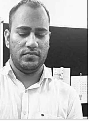
राज्य बीमा प्रवर्धायी विभाग में कार्यरत आरोपी वरिष्ठ सहायक गिरफ्तार किया।

एसीबी मुख्यालय के निर्देश पर भ्रष्टाचार निरोधक ब्यूरो इंटेलीजेंस यूनिट उदयपुर ने कार्यवाही करते हुए आरोपी