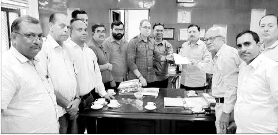
सांगानेर विधायक अशोक लाहोटी (बीच में) के नेतृत्व में लोगों ने आवासन आयुक्त पवन अरोड़ा को ज्ञापन सौंपकर कार्रवाई की मांग की।

— कार्यालय संवाददाता — जयपुर। एसएफएस मानसरोवर में माली समाज की जमीन पर बने मंदिर के जीर्णोद्धार को लेकर स्थानीय लोगों और हाउसिंग बोर्ड के अधिकारियों के बीच तनावनी का माहौल बन गया है। बुधवार को सांगानेर विधायक अशोक