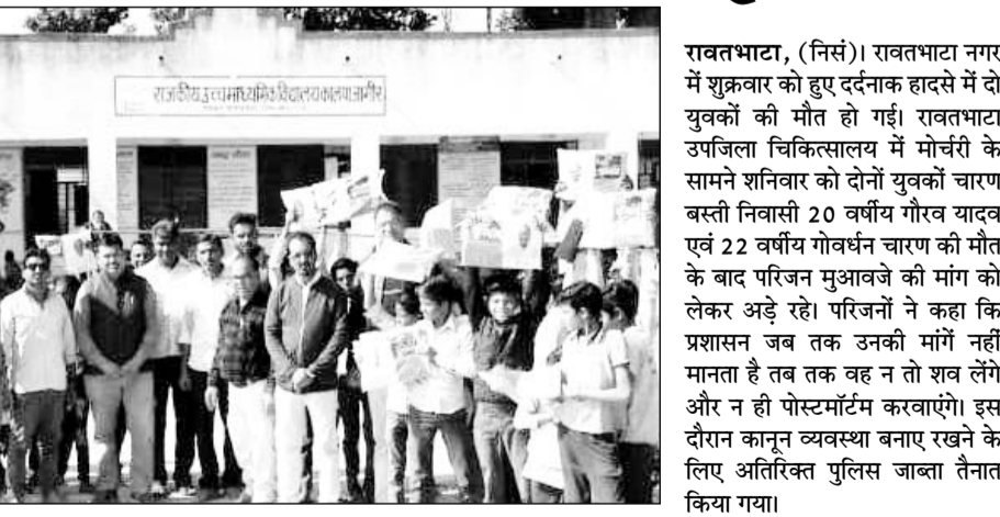
छीपाबडौद के काल्याजागीर राजकीय उच्च माध्यमिक विद्यालय में छात्र छात्राओं को यूनिफॉर्म वितरण किया गया।