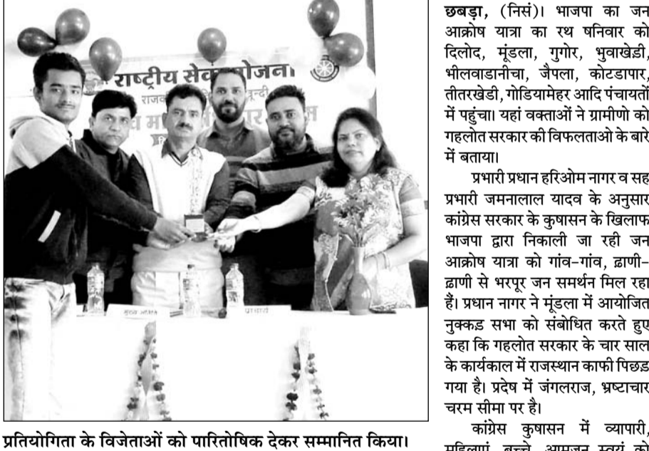
प्रतियोगिता के विजेताओं को पारितोषिक देकर सम्मानित किया।

बून्दी (निसं)। राजकीय महाविद्यालय में संचालित राष्ट्रीय सेवा योजना द्वारा कुशल भारत-सशक्त भारत थीम पर शिबिर आयोजित किया गया।