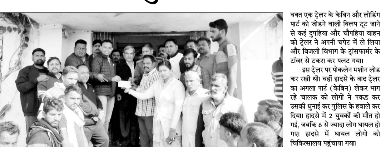
उपखंड कार्यालय में एचसीसी कंपनी की ओर से पांच-पांच लाख रुपए की राशि के चैक दोनों के परिवारों को सौंपा।