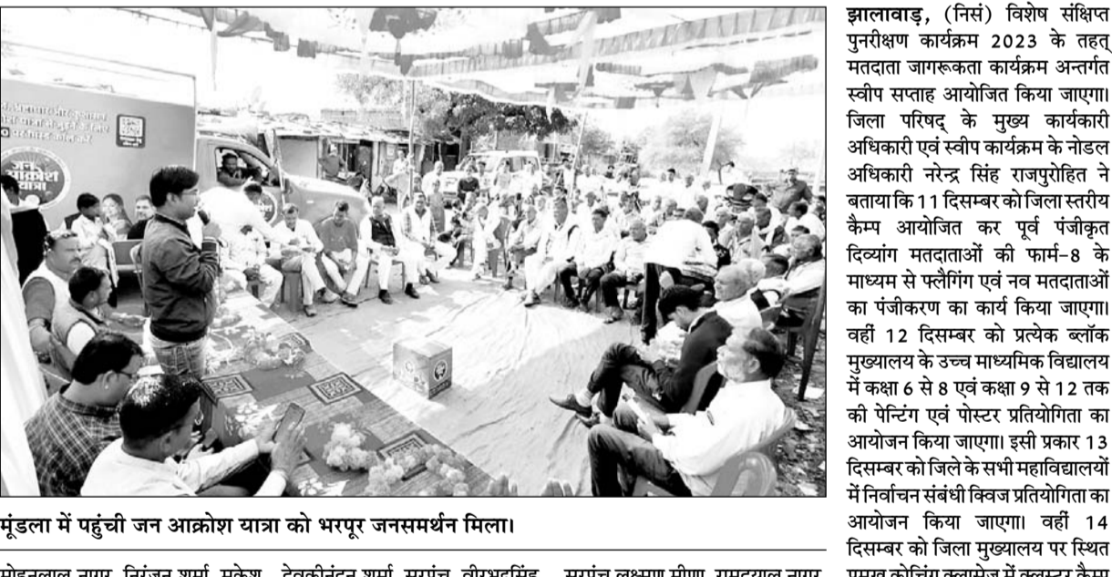
मूंडला में पहुंची जन आक्रोश यात्रा को भरपूर जनसमर्थन मिला।