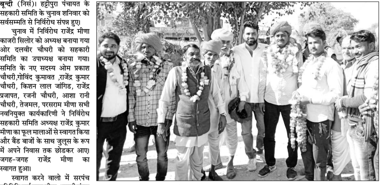
हट्टीपुरा सहकारी समिति निर्विरोध निर्वाचित अध्यक्ष व कार्यकारिणी का स्वागत किया गया।

बून्दी (निसं)। हट्टीपुरा पंचायत के सहकारी समिति के चुनाव शनिवार को सर्वसम्मति से निर्विरोध संपन्न हुए।