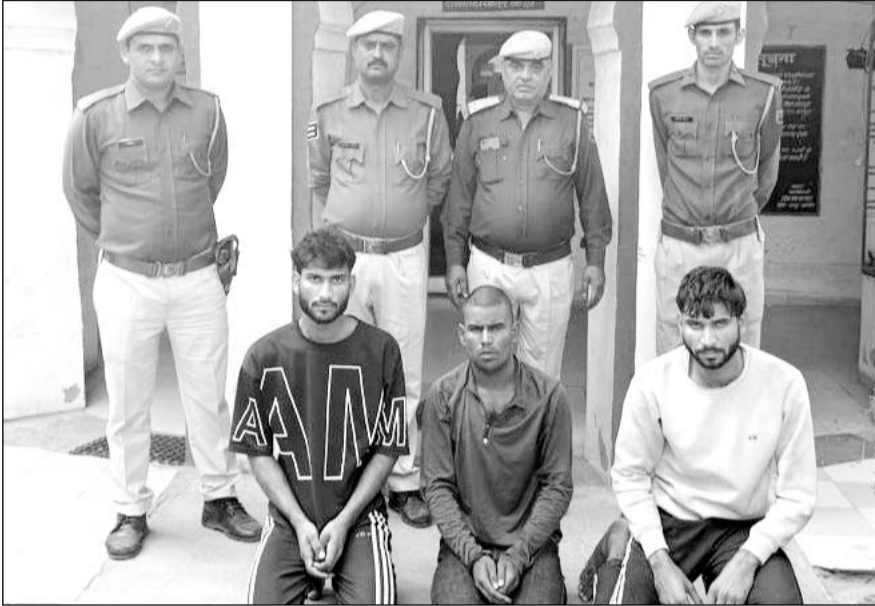
प्रागपुरा थाना पुलिस ने नकबजनी गैंग के तीन आरोपियों को गिरफ्तार किया।