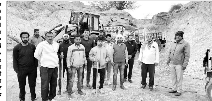
अवैध खनन के खिलाफ प्रशासन ने जीरो टॉलरेंस की नीति के तहत कार्रवाई की।

मौके पर दो जेसीबी मशीनें एवं चार ट्रैक्टर-ट्रॉली खनिज क्वार्टर फेलसपर का अवैध खनन करते पाये जाने पर जब्त किये गये। खनिज विभाग के तकनिकी