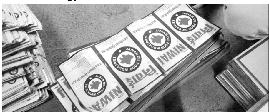
कंपनी के प्रतिनिधि की शिकायत पर पुलिस ने कार्रवाई कर रैपर और अन्य सामान मौके से जप्त किया।