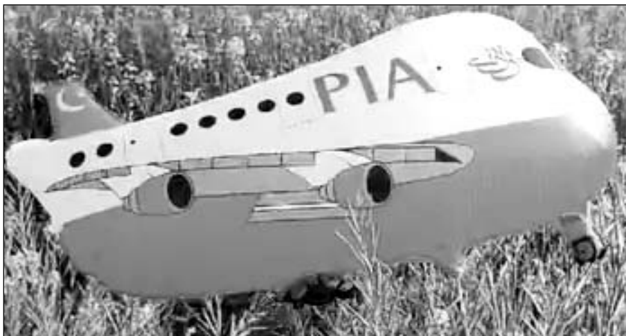
भारत-पाकिस्तान बॉर्डर के पास स्थित गांव में एक बार फिर पाकिस्तानी गुब्बारा मिला।

■ सूचना के बाद बीएसएफ जी ब्रांच और सीआईडी के अधिकारी मौके पर पहुंचे