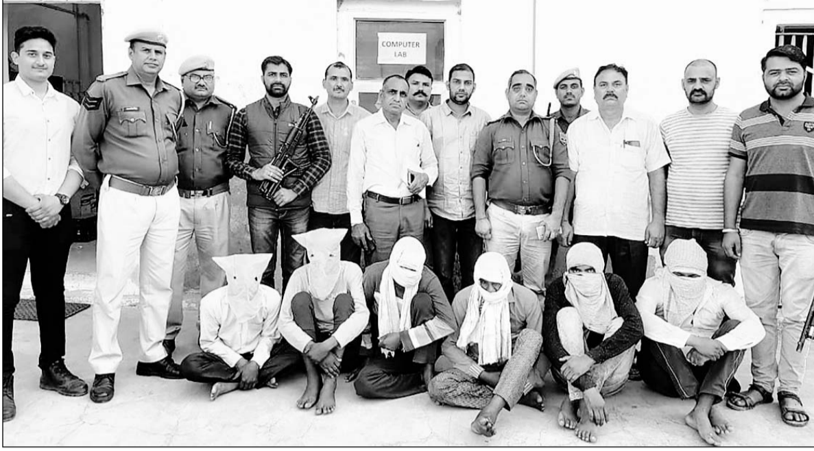
पुलिस ने हरियाणा की शांति बावरिया गैंग के सात सदस्यों के अलावा रैकी करने वाले एक स्थानीय आरोपी को गिरफ्तार किया।

बदमाशों और पुलिस के बीच मौका तस्दीक के दौरान हुई मुठभेड़, आरोपियों ने पुलिस की रिवाल्वर से ही पुलिस पर फायरिंग कर दी