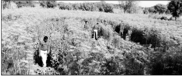
पुलिस ने अवैध रूप से अफीम डोडा-पोस्त की खेती पकड़ी।