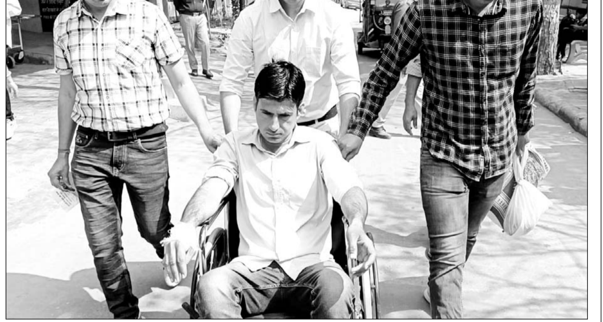
बदमाशों से मुठभेड़ के दौरान एक पुलिसकर्मी घायल हो गया।

झुंझुनू/सूरजगढ़, (निर्स)। थाना इलाके के कुलोठ खुर्द गांव में तीन दिन पहले एक परिवार को बंधक बनाकर पिस्टल की नोक पर की गई डकैती का पुलिस ने खुलासा कर दिया है। पुलिस ने इस मामले में हरियाणा की शांति बावरिया गैंग के सात सदस्यों के अलावा रैकी करने वाले एक स्थानीय आरोपी को गिरफ्तार किया है। बदमाशों ने पुलिस से भागने के चक्कर में फायरिंग भी की। जिसमें ना केवल एक पुलिसकर्मी, बल्कि दो बदमाश भी गोली लगने से घायल हो गए। जिनका ईलाज झुंझुनू के राजकीय बीडीके अस्पताल में चल रहा है।