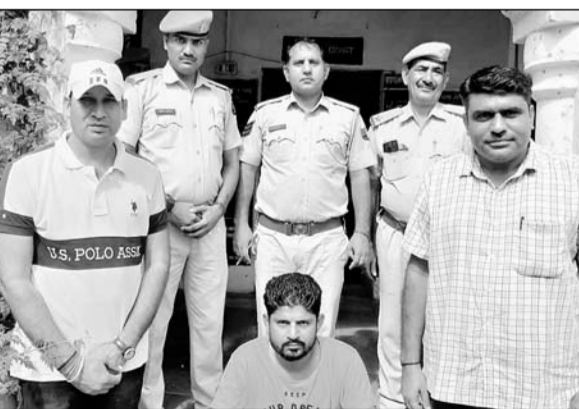
खेतड़ी पुलिस ने हथियार तस्कर को गिरफ्तार किया।

■ आरोपी के कब्जे से एक देशी पिस्टल, दूनाली बंदूक सहित नौ जिंदा कारतूस बरामद किए