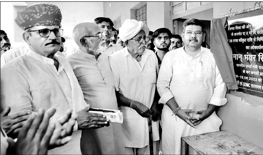
ऊर्जा मंत्री भंवर सिंह भाटी ने बज्जू उपखण्ड के गांवों में नवीन जल संवर्धन योजनाओं का उद्घाटन किया।

जागनवाला में किए गए स्वागत और सत्कार करने पर उन्होंने हृदय से आभार व्यक्त किया और कहा कि विधानसभा क्षेत्र के विकास के लिए धन की कमी आड़े नहीं आयेगी। ऊर्जा मंत्री ने समग्र शिक्षा की ओर संतोष नगर की उच्च माध्यमिक विद्यालय में 17.38 लाख रुपये की लागत से नवनिर्मित 2 कक्षा कक्षा मय बरामदा का उद्घाटन किया। उन्होंने संतोष नगर में 10 लाख राशि से पुस्तकालय निर्माण करवाने