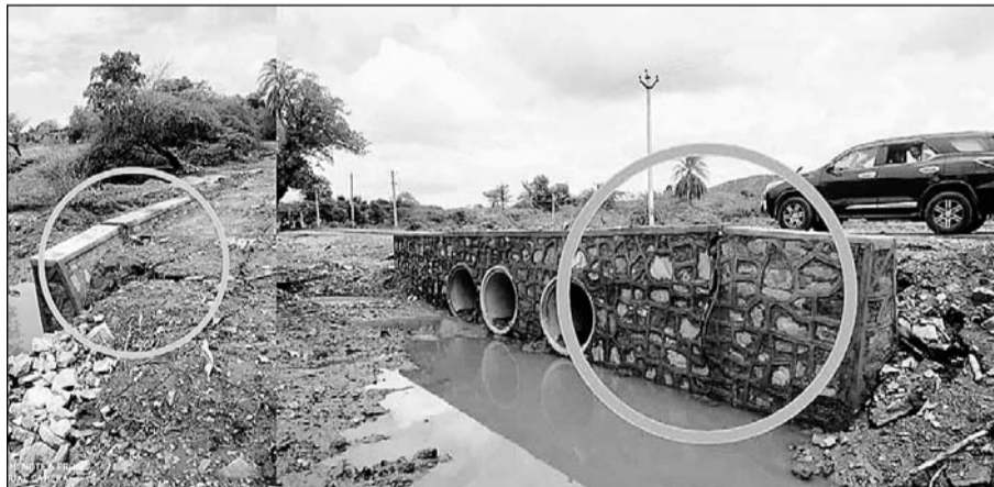
खैरवाड़ा-झुंझुनू मार्ग पर बारों का शेर के निकट क्षतिग्रस्त निर्माणाधीन पुल की दीवारें।

इस पूरी सड़क के निर्माण के लिए केन्द्रीय सड़क परिवहन द्वारा डेढ सौ करोड़ की लागत से बनाने का कार्यदिश व वित्तीय स्वीकृति जनवरी 2022 में जारी की गई है। इसके तहत कार्यकारी एजेन्सी द्वारा पहले चरण में बीते सात माहों में केवल पुलियाओं के निर्माण भी पूरी तरह नहीं कर पाई है और अभी से पुल क्षतिग्रस्त होने लग गये हैं। प्राप्त जानकारी के अनुसार