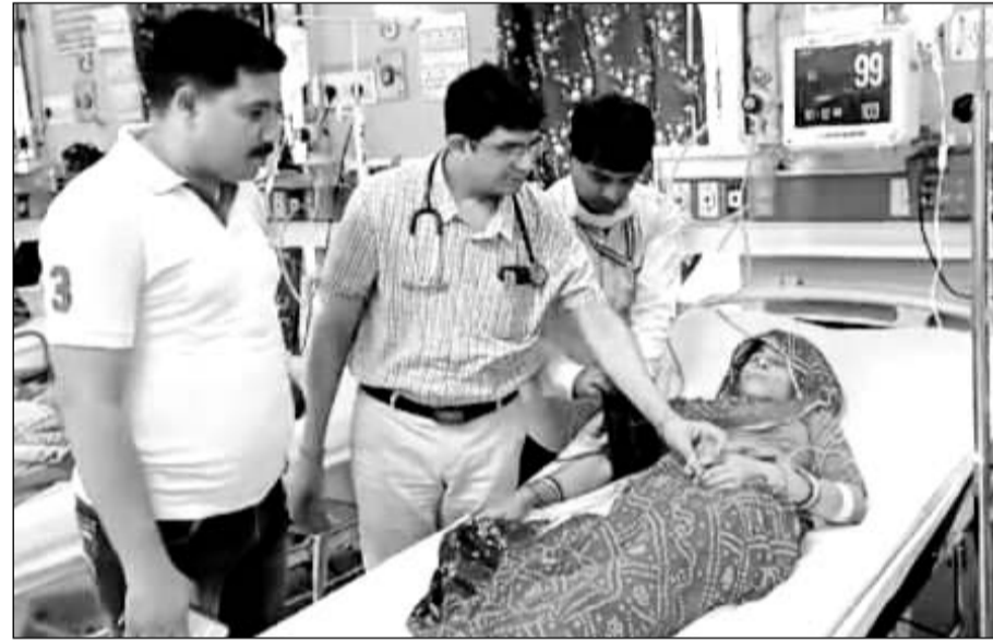
सांप के काटने से अचेत महिला को अस्पताल में भर्ती कराया।

मांची गांव में लगातार हो रही सर्पदंश की घटनाओं को देखते हुए क्षेत्रीय वन अधिकारी ने बताया कि गांव में सांपों की अधिकता की सूचना पर चार कार्मिकों की टीम गठित की गई और करीब आधा दर्जन से अधिक सांपों को पड़कर सुरक्षित जंगल में छोड़ा गया। यही नहीं करौली जिला पुलिस अधीक्षक वृजेश ज्योति उपाध्याय के निवास पर रिकवार को लोन में एक लंबा सांप निकला, जिससे अफरा-तफरी सी मच गई। पास ही