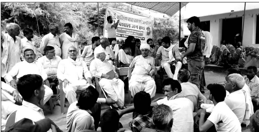
कालिया बाबा काला पहाड़ को खनन से बचाने और इसे धार्मिक क्षेत्र घोषित करने की मांग को लेकर चल रहे आन्दोलन में कई जनप्रतिनिधियों ने शिरकत की।

लोगों ने कहा कि सभी लीजों को समाप्त कराने के लिये आन्दोलन जारी रहेगा। इस पर्वत की गुफाओं में अनेकानेक संत-महात्मा तपस्या करते हैं और संत भक्तों द्वारा अनवरत