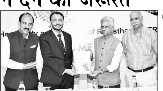
फेडरेशन ऑफ होस्पिटैलिटी एंड टूरिज्म इन राजस्थान की 7वीं वार्षिक जनरल मीटिंग होटल क्लार्क्स अमेर में आयोजित की गई।