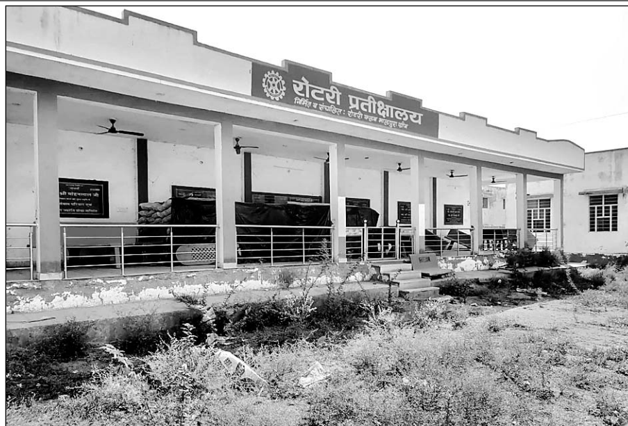
मालपुरा के सरकारी अस्पताल परिसर में रोटरी प्रतीक्षालय कबाड़ बना हुआ है।

मालपुरा, (निस)। राजकीय सामुदायिक स्वास्थ्य केंद्र में आने वाले रोगी व परिजनों के साथ-साथ आमजन एवं वरिष्ठ नागरिकों को सुविधा मुहैया करवाये जाने के उद्देश्य को लेकर रोटरी क्लब मालपुरा सिटी द्वारा जनसहयोग से जुटाये 25 लाख रुपये की लागत से निर्मित रोटरी प्रतीक्षालय आज अस्पताल प्रशासन की उदासीनता के चलते कबाड़ में तब्दील हो गया है। विधानसभा क्षेत्र के एकमात्र व सबसे बड़े मालपुरा के सरकारी अस्पताल में बढ़ती मरीजों की संख्या के साथ-साथ परिजनों व आमजन को ठण्डी छॉब में बैठकर दो पल सकुन के बिताने तथा परिजनों द्वारा परिजनों को सुविधा मुहैया करवाने के उद्देश्य से रोटरी परिवार के सदस्यों ने भामाशाहों को प्रेरित कर 25 लाख रुपये की राशि जुटा अस्पताल परिसर में रोटरी प्रतीक्षालय का निर्माण करवाया था। निर्माण के पश्चात अमजन को बैठने के लिये दो दर्जन से अधिक सिमेंट की कुर्सियां व पंखे लगावाये गये थे, जिनकी देखरेख का जिम्मा अस्पताल प्रशासन को दिया गया था। वर्ष 2014 में प्रतीक्षालय का शिलान्यास व 2021 में राज्यपाल कलराज मिश्र के हाथों प्रतिक्षालय का क्वॉल्ट लोकार्पण कर जनसेवा के लिये समर्पित किया गया था। लोकार्पण समारोह में मौजूद हजारों नागरिकों ने रोटरी परिवार के इस पुनित