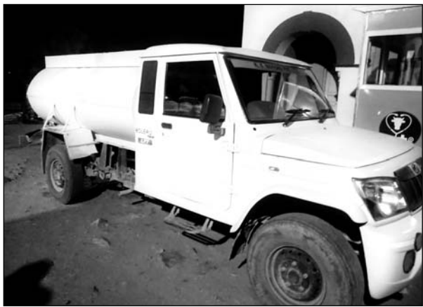
खेतड़ी पुलिस ने अवैध डीजल से भरी पिकअप गाड़ी जब्त की।