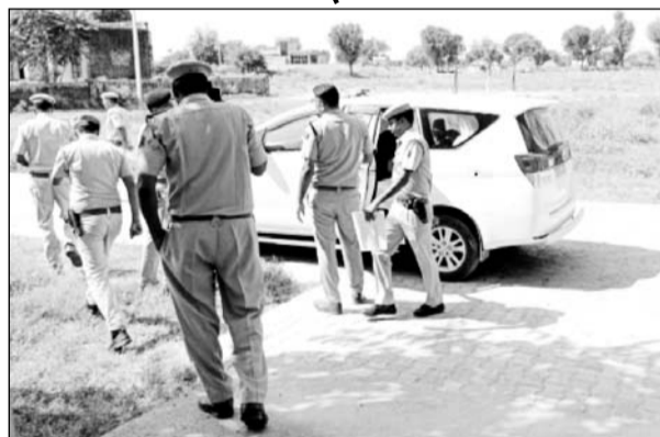
बॉर्डर का निरीक्षण करते नीमकाथाना पुलिस अधीक्षक।

पाटन, (निसं)। नीमकाथाना एसपी ने पाटन एवं डाबला क्षेत्र के मतदान बूथों व बॉर्डर नाकों का निरीक्षण कर दिशा निर्देश दिए। पुलिस अधीक्षक ने हरियाणा राज्य से लगती बॉर्डर व चैक पोस्टों का भी जायजा लिया।