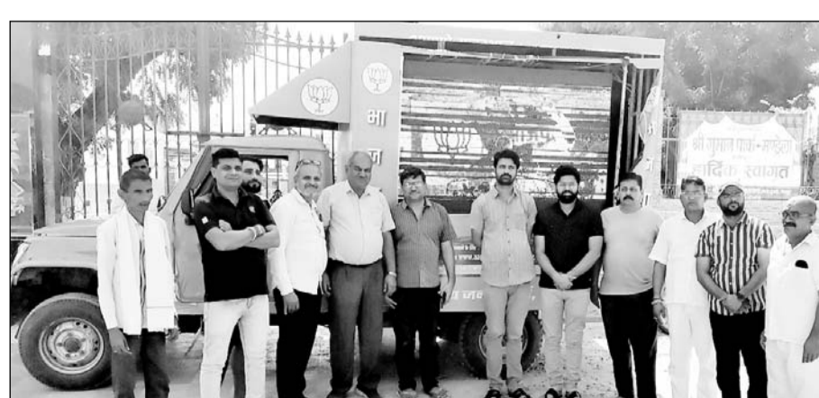
भाजपा की ओर से चलाई जा रही रथ यात्रा मंडेला पहुंची।

रथयात्रा के माध्यम से भाजपा की जन कल्याणकारी नीतियों के बारे में जानकारी देकर लोगों से भाजपा के साथ जुड़ने का आह्वान किया गया। इस दौरान लोगों के मन के अनुसार ही भाजपा सरकार का काम कर रही है। इसके तहत आगामी विधानसभा चुनाव में पार्टी का घोषणा पत्र भी लोगों के मन के अनुसार ही होगा। इसलिए लोगों के मन की बात जानने के लिए पूरे प्रदेश में सुझाव आपका