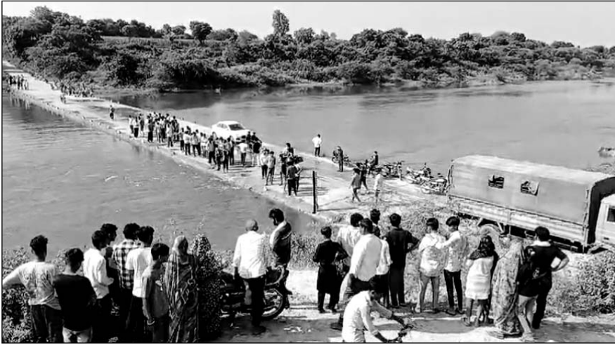
मांडलगढ़ में बीगोद के पास बनास नदी में बहे मां-बेटे के शव 21 घण्टे बाद मिले।