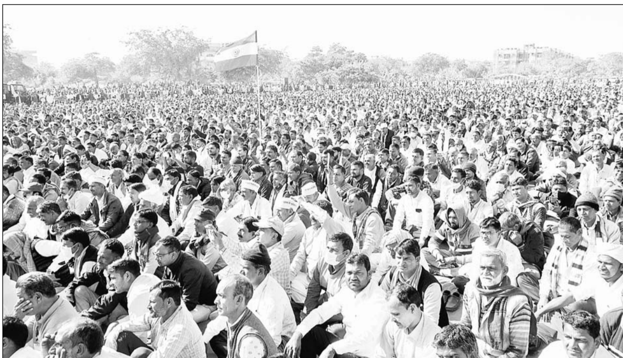
प्रदेशभर से जयपुर पहुंचे राशन डीलरों ने विद्याधर नगर स्टेडियम में महासम्मेलन के जरिये शक्ति-प्रदर्शन किया।

मुख्यमंत्री से बात कर तय कराएं राशन डीलरों का मानदेय : खाचरियावास