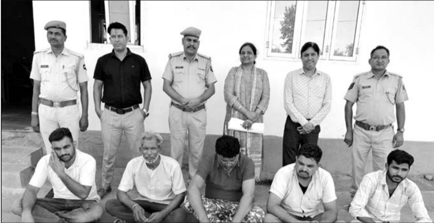
नसीराबाद पुलिस ने टैंकरों से अवैध रूप से गैस रीफिलिंग मामले में पांच जनों को हिरासत में लिया।