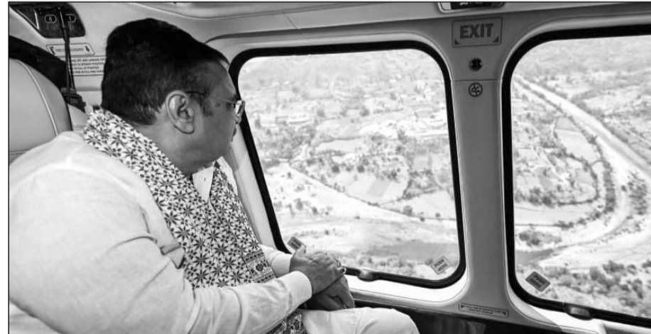
सीएम भजनलाल शर्मा ने देवास-3 एवं 4 पेयजल परियोजना का हवाई सर्वे किया।