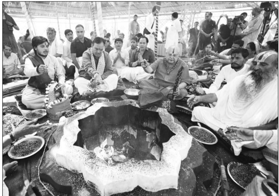
मुख्यमंत्री भजनलाल शर्मा ने शुक्रवार को न्यू सांगानेर रोड स्थित श्री चिंताहरण काले हनुमानजी मंदिर में एकादश कुंडात्मक श्री हनुमत महायज्ञ में आहुति दी तथा प्रदेशवासियों की सुख-समृद्धि और खुशहाली की कामना की।