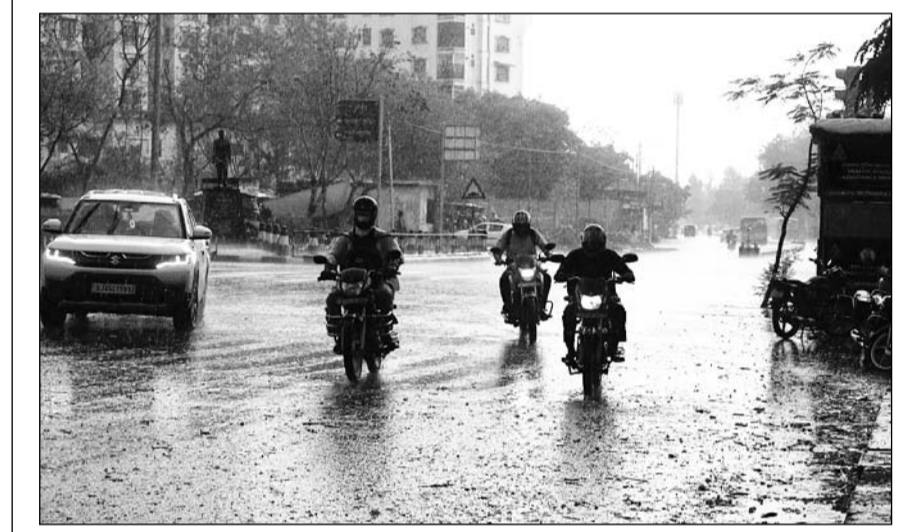
जयपुर में शुक्रवार को अचानक मौसम बदला और आसमान में काले बादल छा गये व तेज हवाएं चलनी शुरू हो गईं। कुछ ही घंटों में ही अंधेरा छा गया व अंधड़ के साथ बारिश शुरू होने से तापमान में गिरावट आई। इससे लोगों को गर्मी से राहत मिली।

जयपुर। कोटखावद थाना इलाके में चौदह वर्षीय नाबालिग का अपहरण करने का मामला सामने आया है। परिजनों ने रिश्तेदार पर लड़की को बहला-फुसलाकर भगा ले जाने का आरोप लगाया है और साथ ही अलमारी के लॉकर में रखे 50 हजार रुपए भी गायब मिले। नाबालिग बेटी के पिता ने थाने में मामला दर्ज करवाया है।