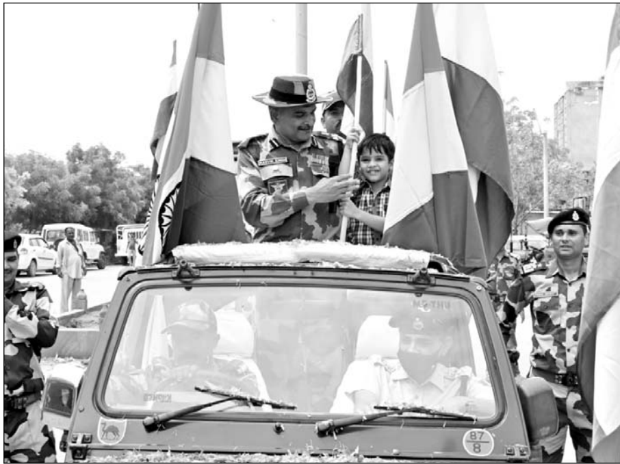
पोकरण में बीएसएफ के जवानों ने तिरंगा रैली निकाली।

पोकरण, (निसं) स्वतंत्रता दिवस के 75वें आजादी के अमृत महोत्सव के अंतर्गत देशभर में चलाए जा रहे घर-घर तिरंगा अभियान के तहत शुक्रवार सुबह सीमा सुरक्षा बल 87 वीं बटालियन की ओर से परमाणु नगरी पोकरण में तिरंगा रैली का भव्य आयोजन किया गया।