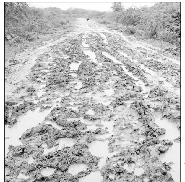
रेवदर के निकट डाक से गोंडाना गोलिया जाने वाले रास्ते पर कीचड़ से लोग को परेशान हैं।

रेवदर, (निसं) रेवदर के निकट अनादरा पंचायत समिति के डाक ग्राम पंचायत मुख्यालय से महज 3 किलोमीटर की दूरी पर स्थित रेबारियों के गोलिया ढाणी के लोगों को बारिश के दिनों में गुजरने में भारी दिक्कतों का सामना करना पड़ रहा है।