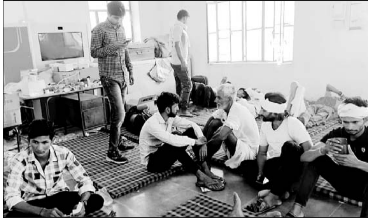
फूड प्वाइजनिंग से बीमार लोगों को केकड़ी जिला अस्पताल में भर्ती कराया।

खाना खाने के कुछ देर बाद लोगों को अचानक उल्टी और दस्त की शिकायत होने लगी थी