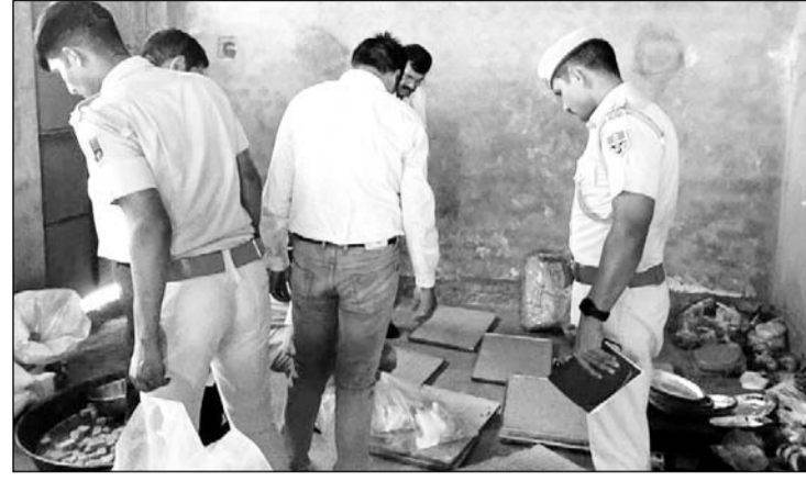
खाद्य विभाग की टीम ने शादी में बने घेवर, मिठाई और तेल आदि के नमूने लिए।

देवली, (निसं)। बीजवाड़ गांव में गुरुवार की रात को एक शादी समारोह में आयोजित भोज में खाना खाने के बाद करीब 150 लोगों की तबियत बिगड़ गई थी। जानकारी के अनुसार गुरुवार की रात को बीजवाड़ गांव में एक शादी थी। इस शादी समारोह में एक हजार लोगों के लिए भोजन बनाया गया था। इस दौरान खाना खाने के कुछ देर बाद अचानक लोगों की अचानक उल्टी और दस्त की शिकायत होने लगी। जब यह संख्या ज्यादा बढ़ने लगी तो प्रामीणी ने तत्परता दिखाते हुए एंबुलेंस और निजी वाहनों के जरिए केकड़ी जिला अस्पताल लेकर पहुंचे जहां पर फूड प्वाइजनिंग की जानकारी लगी। फूड प्वाइजनिंग की वजह से करीब 150