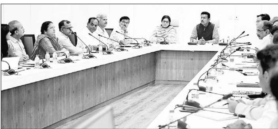
सूचना प्रौद्योगिकी एवं संचार मंत्री कर्नल राज्यवर्धन राठौड़ ने भामाशाह डेटा सेंटर में विभाग के वरिष्ठ अधिकारियों के साथ एक महत्वपूर्ण समीक्षा बैठक ली।

जयपुरा सूचना प्रौद्योगिकी एवं संचार मंत्री कर्नल राज्यवर्धन राठौड़ ने भामाशाह डेटा सेंटर में विभाग के वरिष्ठ अधिकारियों के साथ एक महत्वपूर्ण समीक्षा बैठक ली। इस बैठक में कैबिनेट मंत्री ने अधिकारियों को निर्दिष्ट किया कि वे आधुनिकतम तकनीक को अपनाकर प्रदेश के नागरिकों के लिए उच्च गुणवत्ता की सेवाएं तैयार करें, जिससे राजस्थान सूचना प्रौद्योगिकी के क्षेत्र में देश का अग्रणी राज्य बन सके। कर्नल राठौड़ ने सूचना प्रौद्योगिकी एवं संचार विभाग द्वारा संचालित विभिन्न परियोजनाओं की समीक्षा करते हुए अधिकारियों को संबोधित किया। उन्होंने निदेश दिया कि परिवर्तित बजट 2024-25 के तहत विभाग से संबंधित घोषणाओं का समर्थन और त्वरित निष्पादन सुनिश्चित किया जाए।