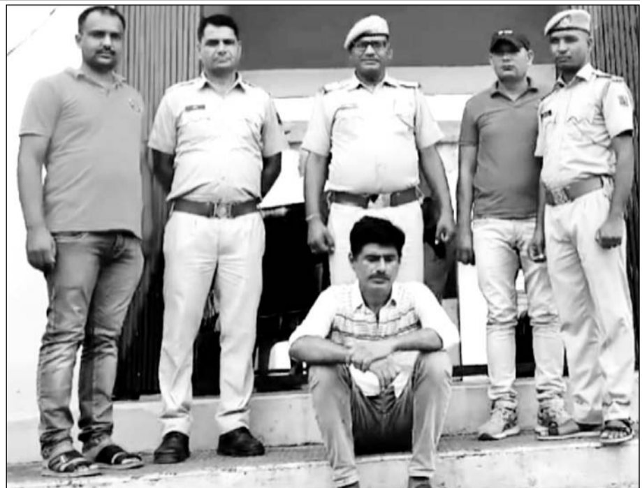
एंटी गैंगस्टर टास्क फोर्स की सूचना पर ब्यावर जिले में बर पुलिस ने तस्कर को गिरफ्तार किया।