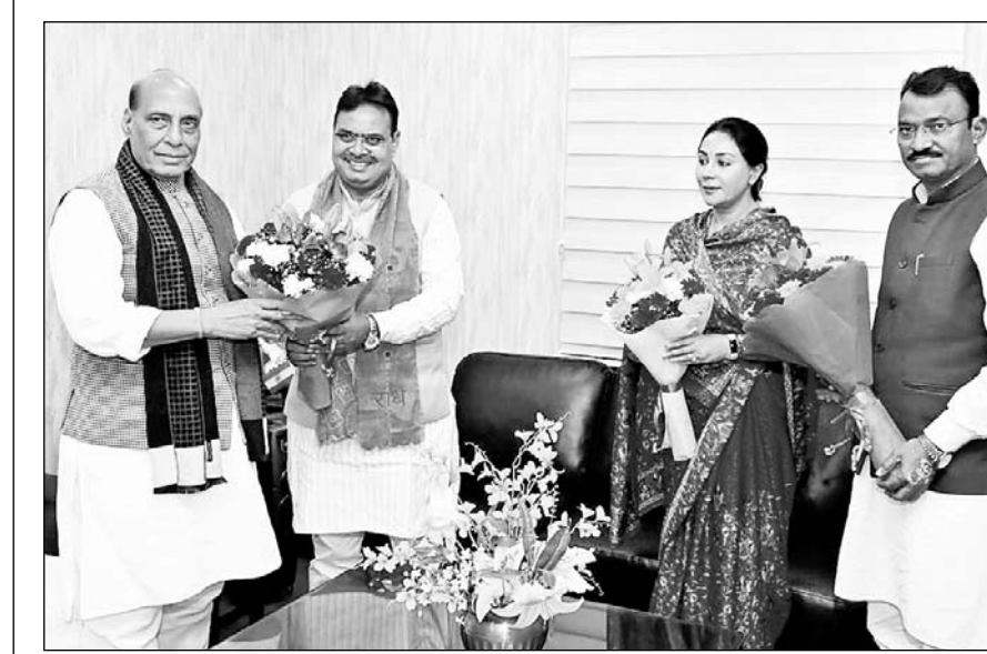
मुख्यमंत्री भजनलाल शर्मा, उपमुख्यमंत्री दीया कुमारी और डॉ.प्रेमचंद बैरवा ने रविवार को दिल्ली में रक्षा मंत्री राजनाथ सिंह से शिष्टाचार भेंट की।