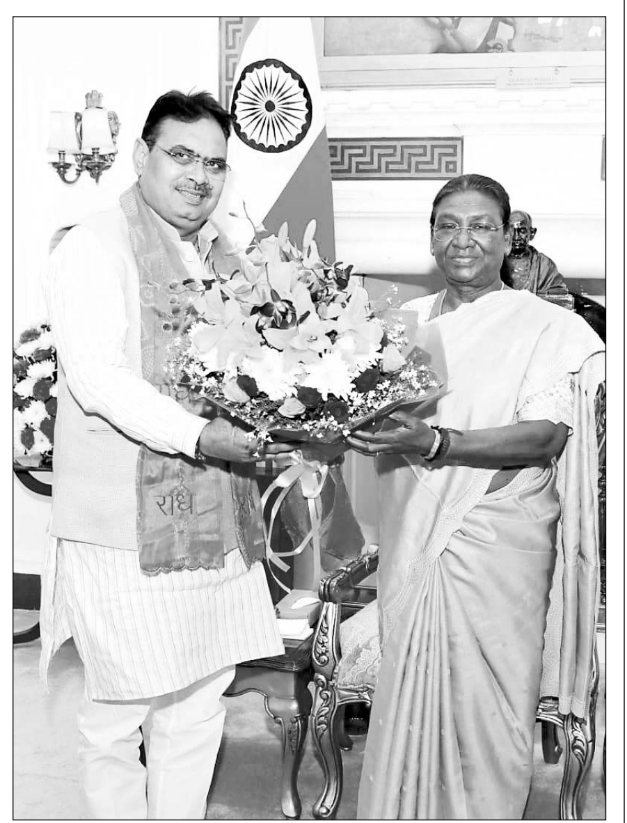
मुख्यमंत्री भजनलाल शर्मा ने रविवार को दिल्ली में राष्ट्रपति त्रैपदी मुमुं से शिष्टाचार भेंट की।

सभी रनर्स को फिनिशर मेडल प्रदान किये गये। फिनिशर मेडल, राजस्थान में दुनिया की सबसे बड़ी और सबसे पुरानी खदानों से प्राप्त शुद्ध और उच्चतम श्रेणी के जिंक से बने हैं, जो वेदांता समूह की एक इकाई हिंदुस्तान जिंक लिमिटेड द्वारा उत्पादित किये जाते हैं।