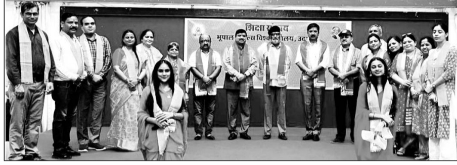
बीएन शिक्षा संकाय में शिक्षक दिवस का आयोजन हुआ।