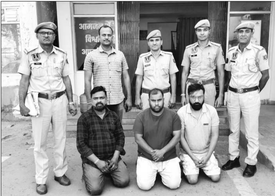
श्याम नगर थाना पुलिस ने जयपुर विकास प्राधिकरण का फर्जी पट्टा बनाकर बेचने करने वाली गैंग के तीन आरोपितों को गिरफ्तार किया गया है।

जयपुर। श्याम नगर थाना पुलिस ने कार्रवाई करते हुए एक प्लॉट का जयपुर विकास प्राधिकरण (जेडीए) का फर्जी पट्टा और मुख्तारनामा बनाकर चार करोड़ रुपये में बेचने वाली गैंग के मुख्य आरोपित सहित तीन आरोपियों को गिरफ्तार किया गया है। फिलहाल आरोपियों से पूछताछ की जा रही है।