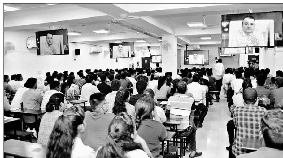
उत्कृष्ट क्लासेस द्वारा जयपुर में यू.पी.एस.सी. सहित स्टेट सिविल सेवा परीक्षा के लिए प्रयासरत विद्यार्थियों के लिए कार्यशाला का आयोजन किया गया।