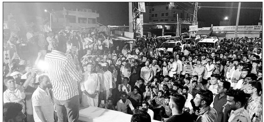
बालोतरा में आरएलपी सांसद हनुमान बेनीवाल ने सभा को सम्बोधित किया।

बालोतरा, (निर्स)। बाड़मेर जिले के बालोतरा में रविवार सुबह 5 बजे रैली रालपा सांसद हनुमान बेनीवाल ने रैली को सम्बोधित किया। शनिवार को बालोतरा में रात्रि के समय हनुमान बेनीवाल की एक रैली होने की बात कही जा रही थी। इसकी जानकारी के बाद दूर-दूर से सैकड़ों की संख्या में युवा व पार्टी के समर्थक बालोतरा में जमा होना शुरू हो गए, लेकिन देर रात तक हनुमान बेनीवाल बालोतरा नहीं पहुंचे। रविवार सुबह तड़के 4.00 बजे बालोतरा शहर में डीजे की आवाज के साथ धमाल मचना शुरू