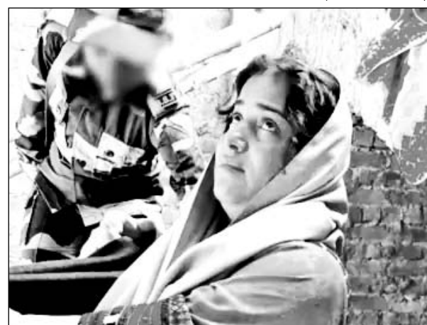
बीएसएफ ने भारत-पाक बॉर्डर पर घुसपैठ कर रही महिला को पकड़ा।

जांच कर रही है। वे यह पता लगाने का प्रयास कर रही है कि महिला का भारत