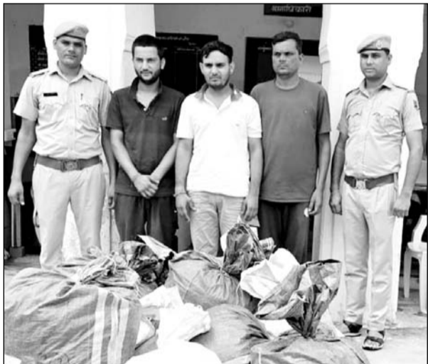
बौली व सर्वाई माधोपुर थाना पुलिस ने तस्करी को गिरफ्तार किया।