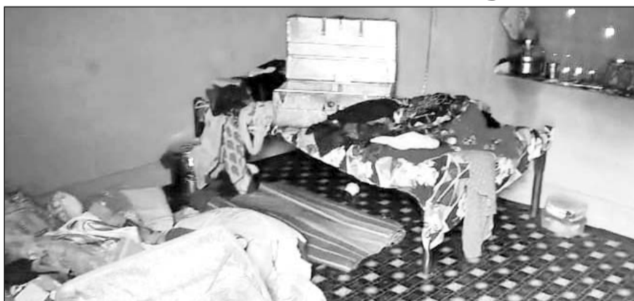
चोरी की वारदात के बाद घर में सामान बिखरा पड़ा है।

पावटा, (निर्सं)। क्षेत्र में चोरी की वारदातें धमने का नाम नहीं ले रही है। चोरो ने तीन अलग-अलग जगहों पर चोरी की वारदातों को अंजाम दिया। इन मामलों में शिकायतों के आधार पर भाबरू थाना पुलिस ने मामला दर्ज कर जांच शुरू कर दी है।