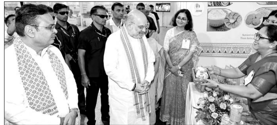
केंद्रीय गृह एवं सहायता मंत्री अमित शाह और मुख्यमंत्री भजनलाल शर्मा ने सहकार एवं रोजगार उत्सव सम्मेलन के अवसर पर राजीविका की प्रदर्शनी का अवलोकन किया।